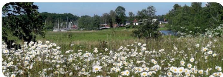
Kungsör, vid Mälarens strand - välkommen till kungariket!