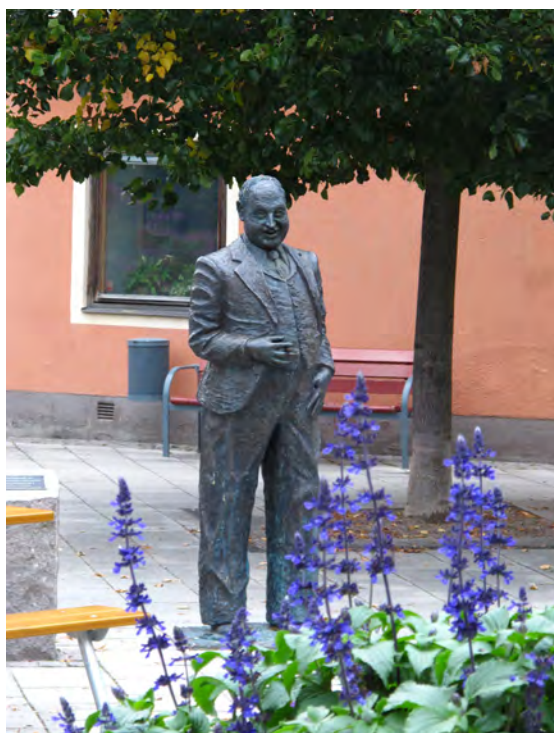
Thor Modéen föddes i Kungsör 22 januari 1898. Skådespelaren och revyartisten spelade in 88 filmer.

Konst- och hantverkssafarin arrangeras varje år en helg i maj. Då kan du på ett 20-tal olika platser, både i tätorten och runt om i de vackra omgivningarna, besöka cirka 50 konstnärer och hantverkare. Under övriga året pågår olika konstutställningar i bibliotekets utställningshall och det finns flera aktiva konstnärer och hantverkare i och runt Kungsör.