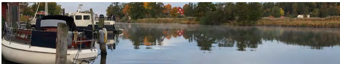
Gästhamnen en oktober morgon.

Kungsörs brukshundklubb driver och sköter hundarenan. Hallen på cirka 1 100 m 2 är uppvärmd och lämpar sig bäst för hundträning. Hallen går också att hyra.