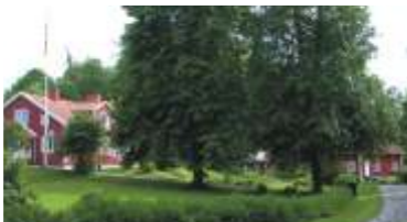
Vägen genom Kungs-Barkarö by

Efter att ha följt Jägaråsen går leden västerut in över slätten. Ta ett dopp vid Bottens badplats eller gör en avstickare norr ut till fågelrika Barkarövikens med sitt utkikstorn, innan leden viker av och avlägsnar sig från Mälaren.