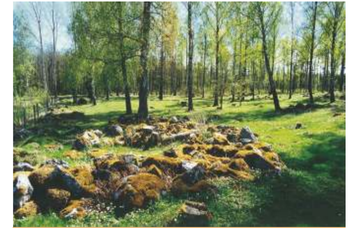
Lövsalar vid Ekeby, Östra slingan.

Längs leden finns fyra rastplatser, två på vardera den östra och västra slingan. För allas trevnad ta med dig