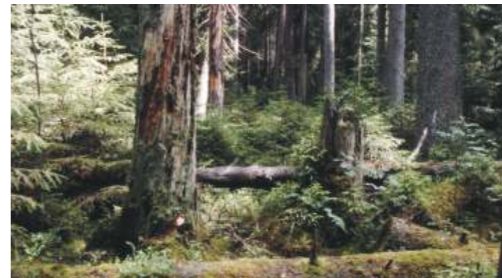
Naturskog vid Stengärdet, Västra slingan.

Visa hänsyn till markägare och boende samt andra fri- luftsutövare längs leden. Respektera att det inte är tillåtet att rida över gräsmattor, tomter, planteringar, åkrar och vallar samt övrig ömtålig mark.