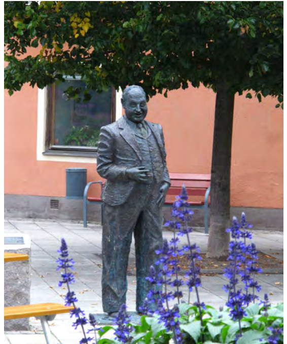
Thor Modéen föddes i Kungäsvör 22 januari 1898. Skådespelaren och revyartisten spelade in 88 filmer.

Konst- och hantverkssafarin arrangeras varje år en helg i maj. Då kan du på ett 20-tal olika platser, både i tätorten och runt om i de vackra omgivningarna, besöka cirka 50 konstnärer och hantverkare. Under övriga året pågår olika konstutställningar i bibliotekets utställningshall och det finns flera aktiva konstnärer och hantverkare i och runt Kungäsvör.