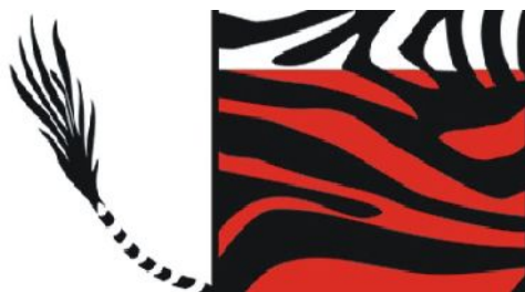
Ta chansen att vara med som utställare under årets konst- och hantverkssafari, ett unikt skyltfönster för lokala konstnärer och hantverkare.

Årets datum för konst- och hantverkssafari är den 12-13 maj.