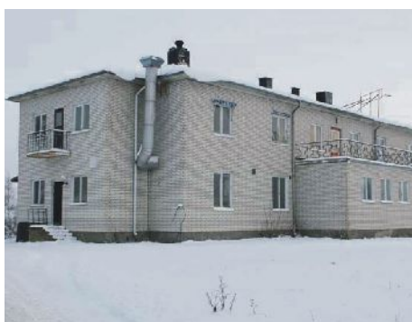
Huset vid Borgvik kommer att rivas under våren och på sikt ge plats för nya bostäder.